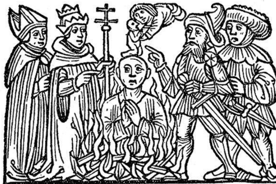
Zdroj: Processus consistorialis martyrii Johannis Huss (1525)

Stačí jen kliknout na ikonu Radia Praha a poslouchat. Vyzkoušejte to!