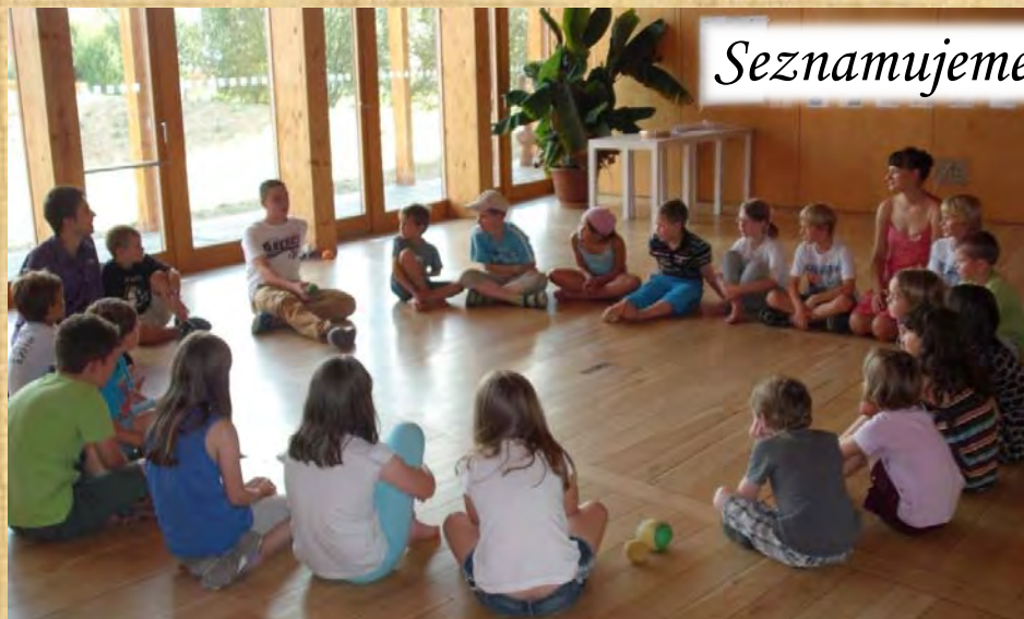
Seznamujeme se 1