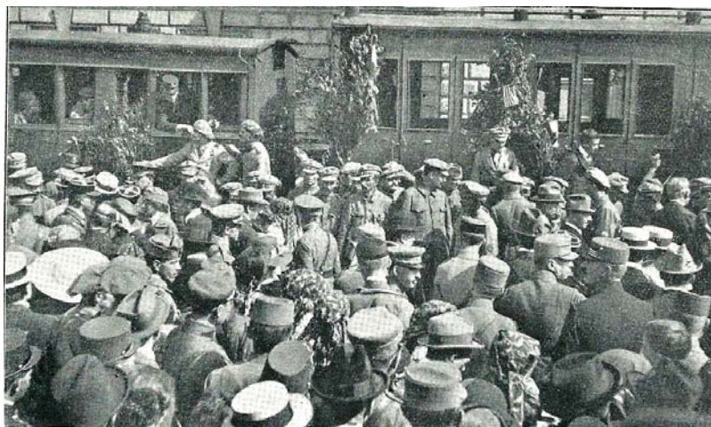
Po příjezdu do Československa.