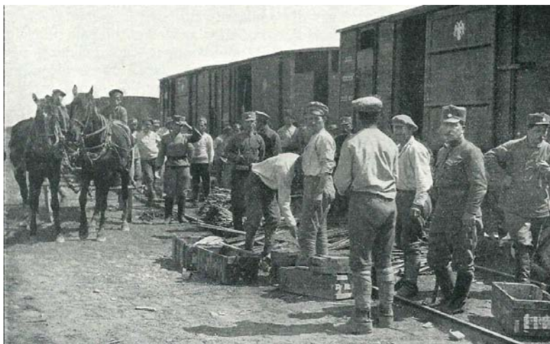
Příprava zbraní a střeliva pro frontu.

Zdroj: MEDEK, R. – HOLEČEK, V. – VANĚK, O. Za svobodu: obrázková kronika československého revolučního hnutí na Rusi 1914-1920. Díl IV. Od Volhy na Urál. Magistrála. Návrat do vlasti. 1918-1920. Praha: Památník odboje, 1929. Str. 524