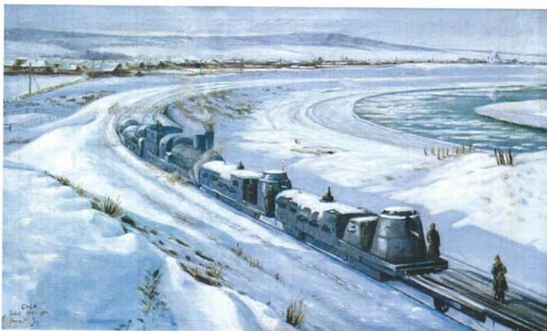
CHARVÁT, J – PICHLÍK, K. (úvod). Cestou ze Sibíře do vlasti . Praha: Votobia, 2001.