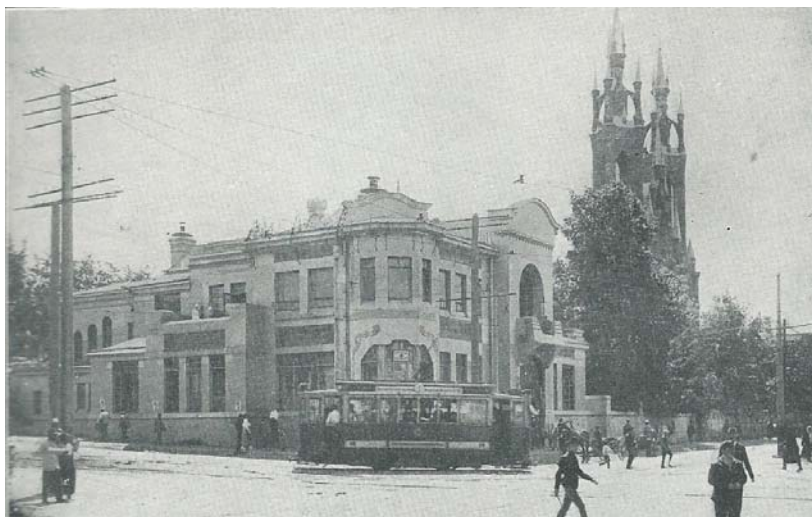
Samara (na snímku Dům velitelství Čechoslováků)

Zdroj: MEDEK, R. – HOLEČEK, V. – VANĚK, O. Za svobodu: obrázková kronika československého revolučního hnutí na Rusi 1914-1920. Díl III. Anabase 1918-1920. Praha: Památník odboje, 1926. Str. 35