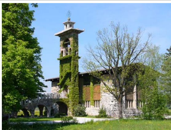
Kostel sv. Michala na blatech u Lublaně (od J. Plečnika)

divokými bouřkami a lijáky. Druhý den už bylo krásně, tak jsme se s dcerou vydaly na obhlídku nového domova. Centrum města je milé a malé, příjemně rozložené okolo říčky Ljublance. Nábřeží je obsypáno kavárnami, které jsou v kteroukoli denní dobu plné lidí, zejména mladých. O to více nás překvapovala omšelost a zanedbanost mnoha historických domů, což činilo celkový dojem poněkud smutnější.