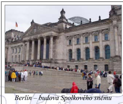
Berlín – budova Spolkového sněmu

Asi horší než to, že jsem byla sama v zcela cizím prostředí, byl nástup do školy. Děti v 10 letech umí být pěkně zákeřné a ve chvíli, kdy objeví někoho, komu nerozumí, on nerozumí jim a ještě se jim třeba nelíbí, stává se tento člověk terčem posměchu.