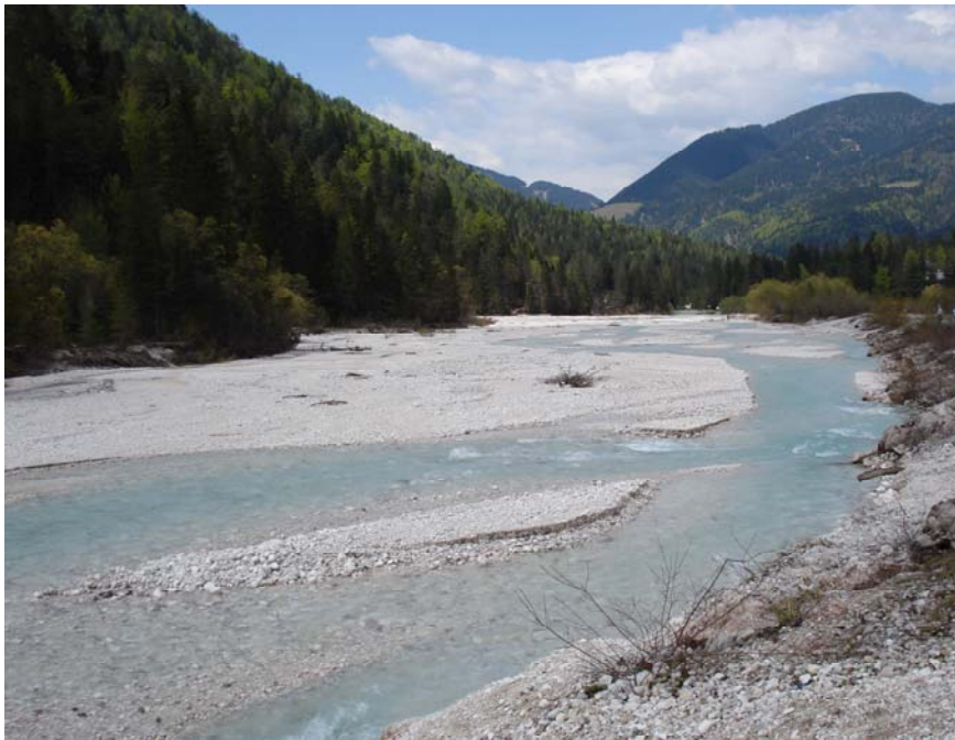
Jeden z mnohých horských toků

v horách okolo řeky Soči. Překrásná horská krajina je dodnes zjizvena stopami po zákopech a množstvím válečných hrobů. V nich jsou mj. uloženy pozůstatky několika desítek tisíc českých vojáků rakouské armády. Putování po Soči se stává čím dále tím oblíbenější destinací českých cestovatelů, z nichž mnozí přitom pátrají po stopách svých předků.