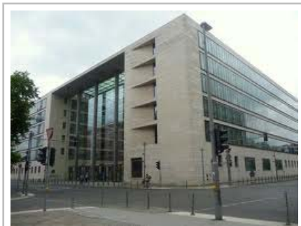
Berlín – Ministerstvo zahraničních věcí

Německé MZV nabízí různé kurzy, například: jazykové, workshopy mezikulturních znalostí, speciální semináře