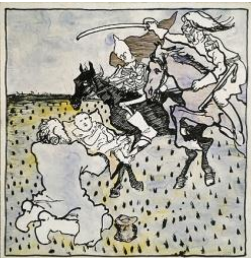
A - Drang nach Osten , Michel im Sumpf, VHÚ, 1918