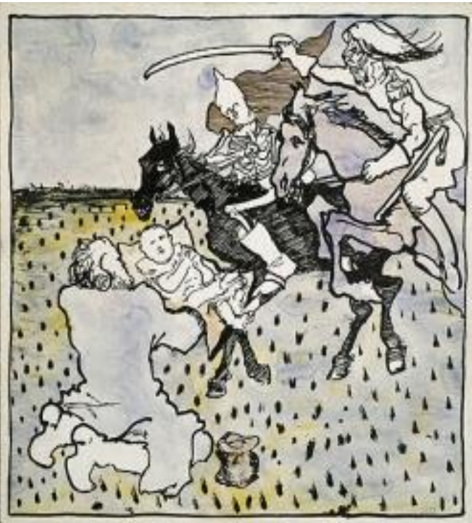
B - Drang nach Osten, Michel im Sumpf, VHÚ, 1918